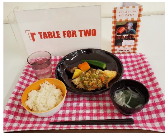
社員食堂ヘルシーメニュー一例